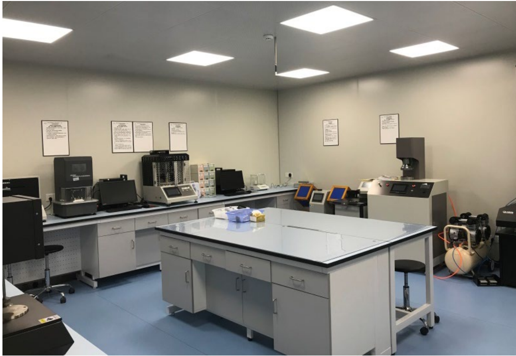
Figure 0-1 警用服装服饰检验实验室

“警用服装服饰检验实验室”目前拥有恒温恒湿实验室、静电实验室、水洗室等多个纺织品专业检验实验室，已配置包括日晒气候试验机（水冷）、马丁代尔耐磨仪、纺织品液态水分传递性能测试仪、汗渍色牢度仪、耐洗色牢度仪、电子织物强力机等在内的 50 余台检测用设备，检测业务可全面覆盖各类特警、民警、辅警用服装服饰。